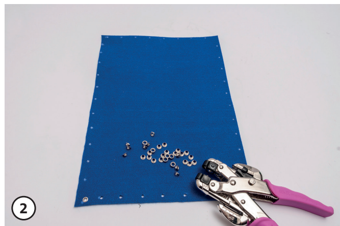
2 Applica gli occhielli ad intervalli di circa 1,2 cm lungo il bordo.