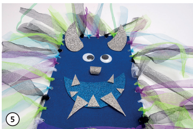
5 Crea il viso del mostro ritagliando il pannolenci glitter di vari colori ed incolla gli occhi mobili.