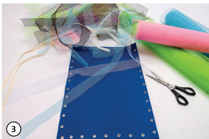
3 Taglia strisce di tulle.