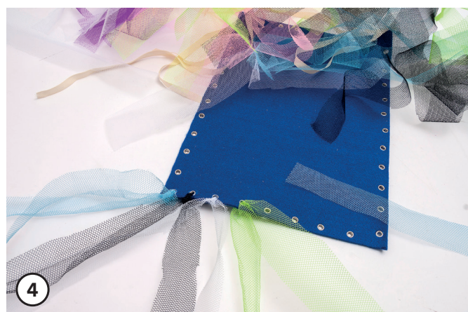
4 Annoda le strisce di tulle.