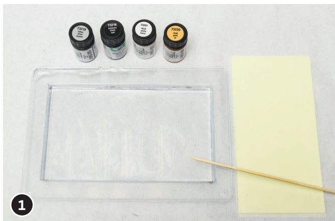
1 Riempire la ciotola con un dito d'acqua.