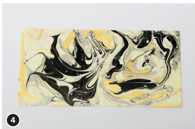
4 Appoggiare delicatamente il foglio di cera sulla superficie dell'acqua marmorizzata e premere leggermente. Rimuovere con cautela, lasciare asciugare e finito.

Il team creativo OPITEC ti augura buon divertimento!